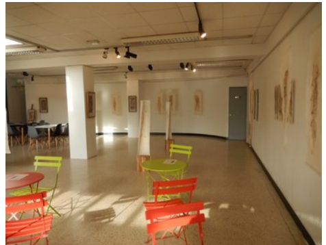
Espace Galerie / Exposition de Katia Renvoisé / mi-septembre à mi-novembre 2018